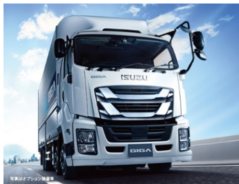
走ろう、いっしょに。 ★「5ツ星トラック」誕生 GIGA 誕生

ことができます子会社や下請企業へ設備を貸与する場合、賃貸料は下請代金や販売委託費などと相殺することが多く、また設備の減価償却も行う必要があります。これらの煩雑な管理もリースを利用すれば合理的に行うことができます。